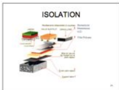
isolation du bâtiment