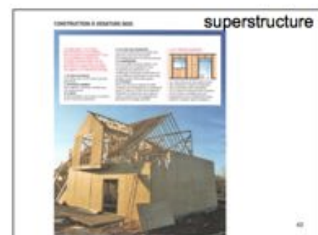
différents types de bâtiments