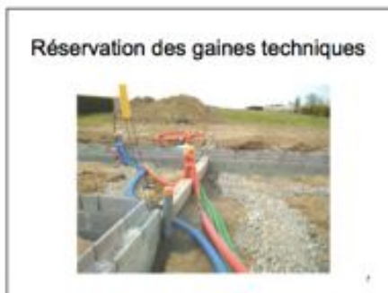
chantier de construction