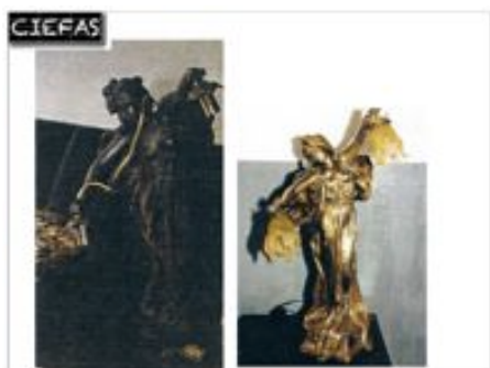
statuette cuivre : avant et après