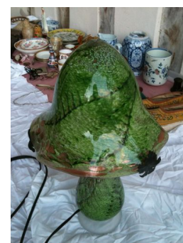
lampe : avant et après