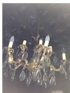
traitement d'un lustre cristal