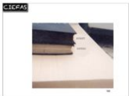
traitement de livres : avant et après