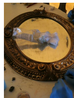
réfection de la dorure