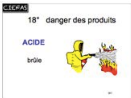
danger des produits