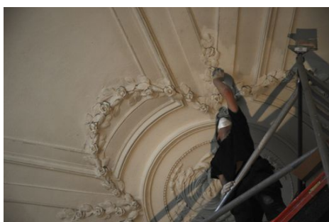
travail en hauteur