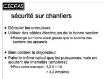
sécurité sur chantier