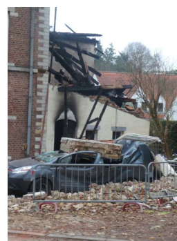
mise en sécurité du site