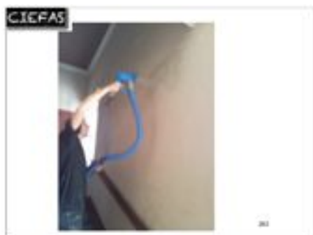
injection-extraction surface murale