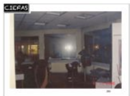
salon de coiffure : avant