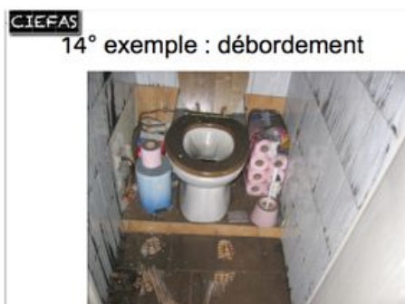
débordement de toilettes