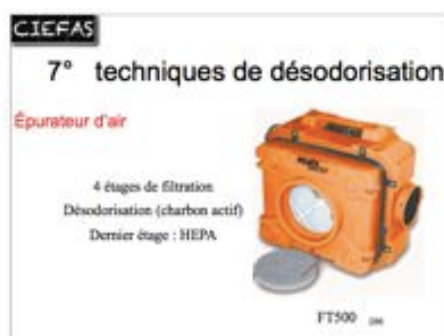
techniques de destruction des odeurs