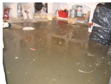
dégât des eaux