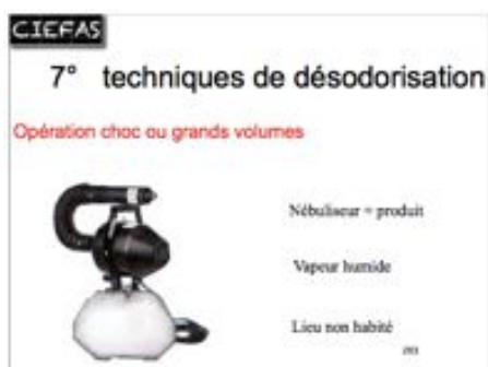
techniques de destruction des odeurs