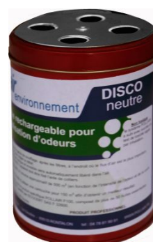
techniques de destruction des odeurs