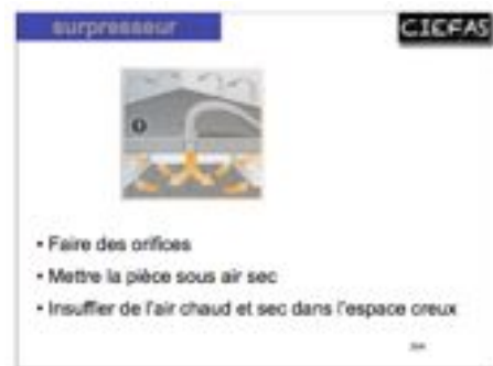
assécher les parquets