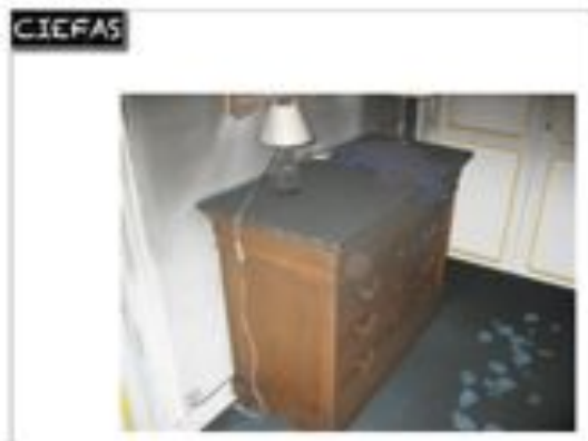
moquette non protégée