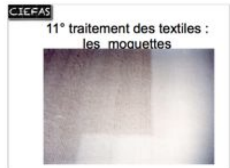
traitement d'une moquette