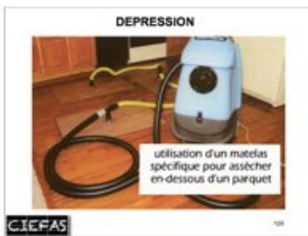
assécher les parquets