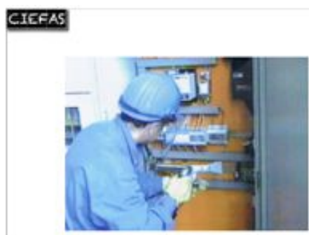
méthode de travail