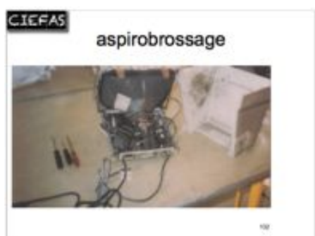
méthode de travail