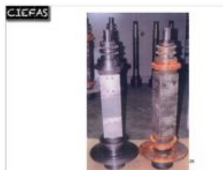
désoxydation de pièces mécanique