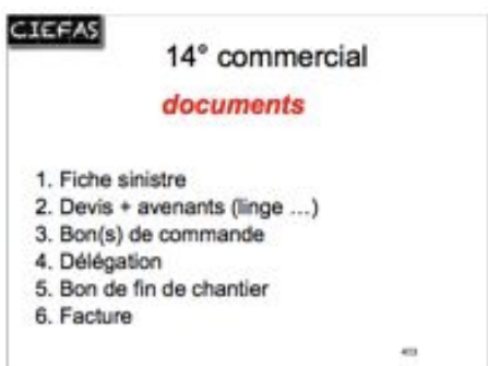
mise en place de la chaîne administrative