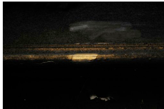
test sur dorure