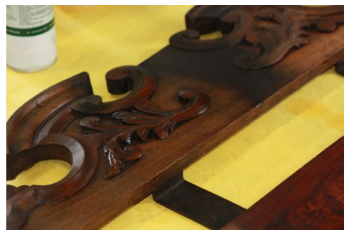
test sur boiserie