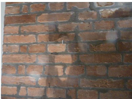
test sur mur en briques