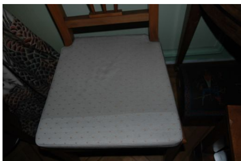
test sur siège textile