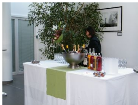
préparation d'une réception