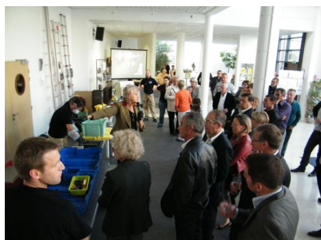
préparation d'une réception