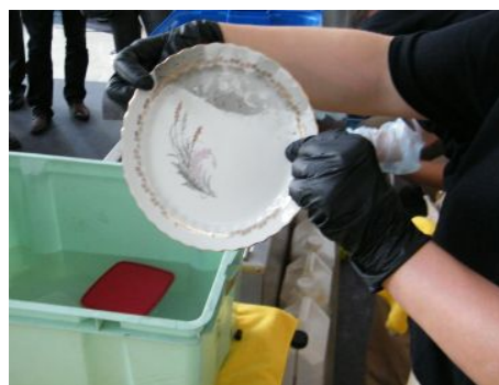
révision des méthodes