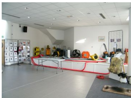
préparation des stands