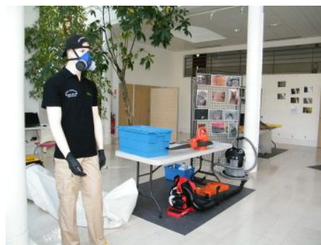
préparation des stands