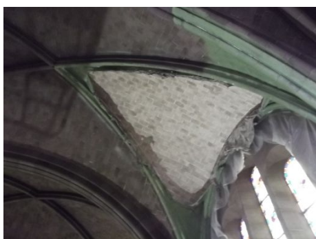
connaissance des techniques : peeling