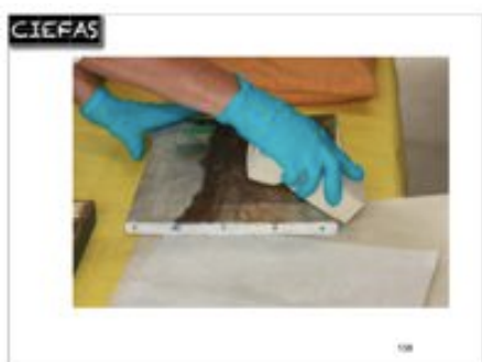
connaissance des produits : éponge à sec