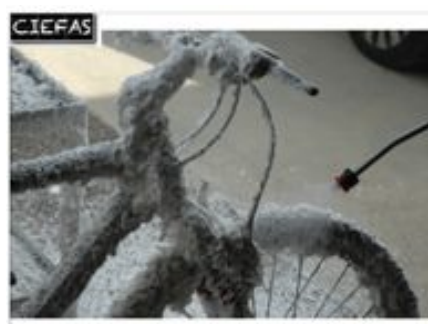
connaissance des techniques : mousse