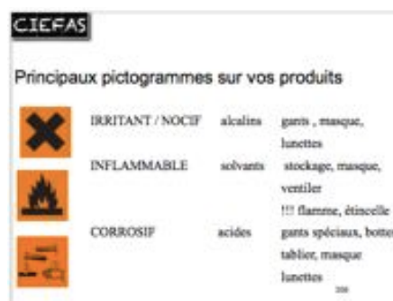
sécurité sur chantier : danger des produits