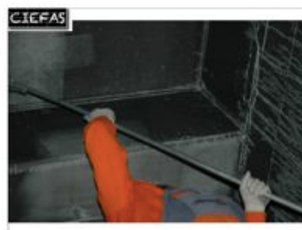
connaissance des techniques : prétraitement